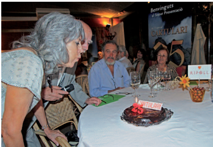
El president de l'Institut i la directora del Cartuari, en el moment d'apagar les espelmes del pastís d'Aniversari

Al sentir aquestes paraules no vaig poder deixar de recordar, amb una mica de nostàlgia, que al Cartulari número 1, de 1987 , vaig publicar l'article, "LA HISTÒRIA PLORA, Catalunya ha de ser pionera en conservar el patrimoni històric" . D'ençà han passat molts anys i la revista ha anat evolucionant i creixent; per tant, crec que tots els que hem col·laborat en aquest projecte ens hem de sentir satisfets de la tasca feta.